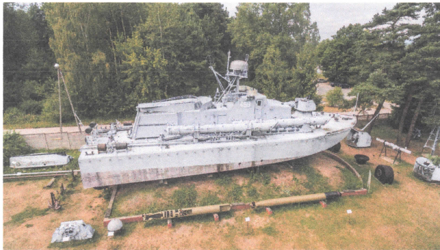
Miejsce posadowienia platformy dla zwiedzających