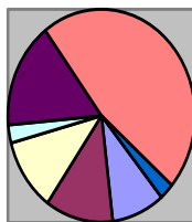
Wykres 2. Liczba uczestników działań profilaktycznych w 2023 r.