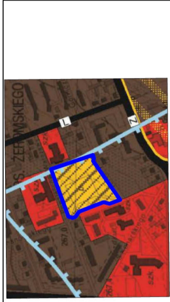
WYRYS ZE STUDIUM SKALA 1:10000