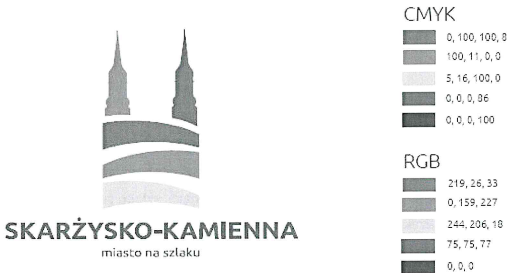
Ryc. 1. Obowiązujący logotyp gminy Skarżysko-Kamienna.

Wersja podstawowa to logo w kolorach czerwono-niebiesko-żółtym (kolory sygnetu) i szarym/srebrnym (kolory logotypu) na białym tle. Wersja podstawowa powinna być wykorzystywana we wszystkich materiałach kolorowych.