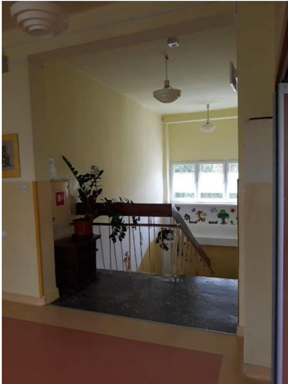
Widok klatki schodowej piętro