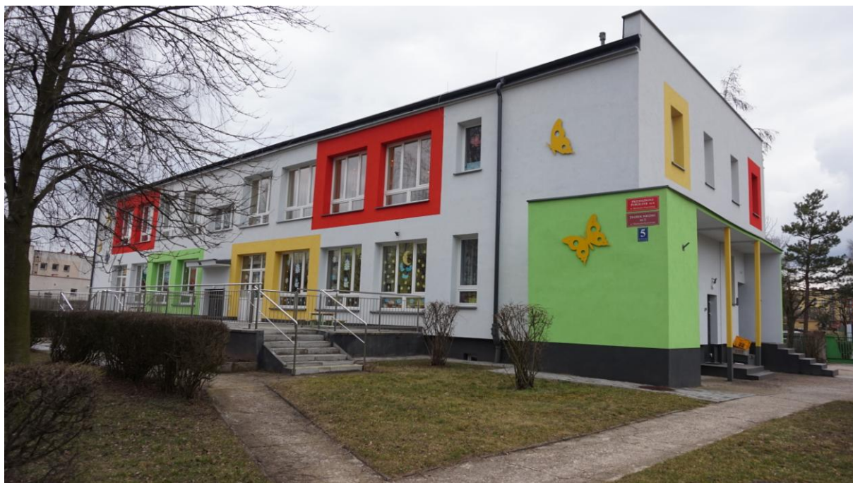
Widok budynku przedszkola