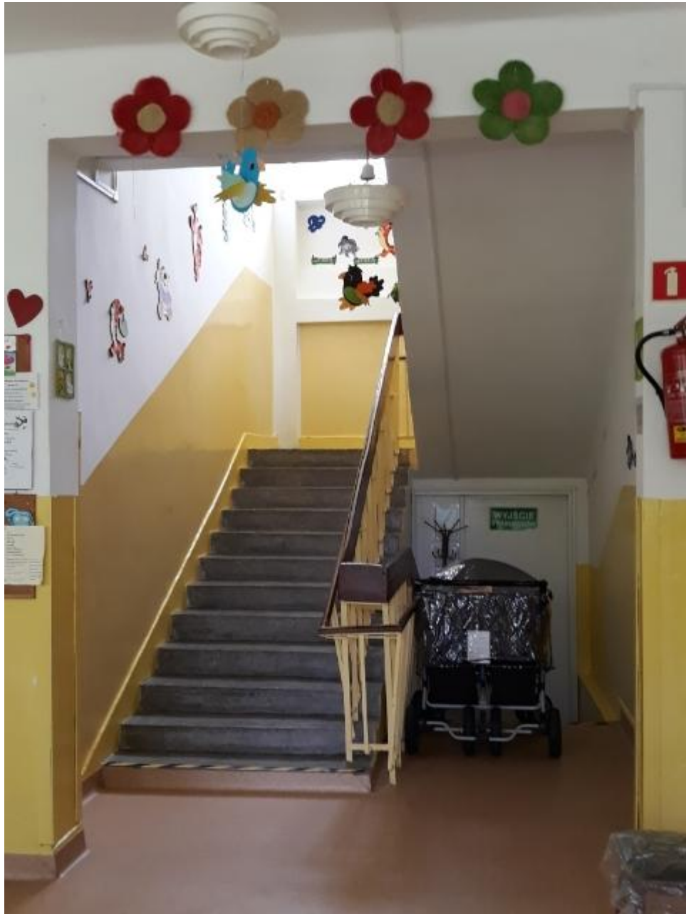
Widok klatki schodowej parter